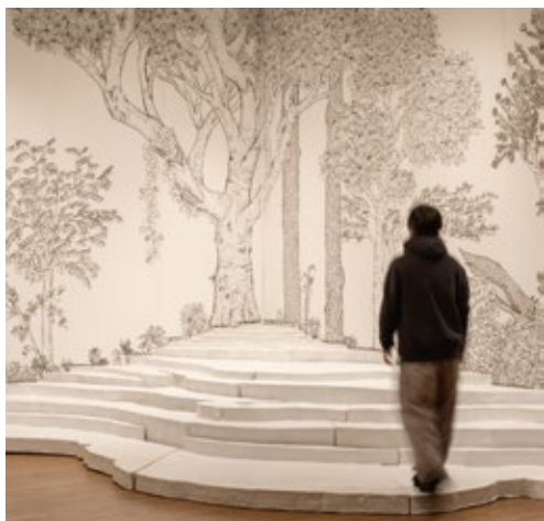
DOUBLE ANNUAL PREVIEW展 京都会場 2023 | ギャラリー・オーブ | 撮影: 顧劍亭