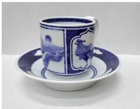
「カップアンドソーサー」(陶芸)